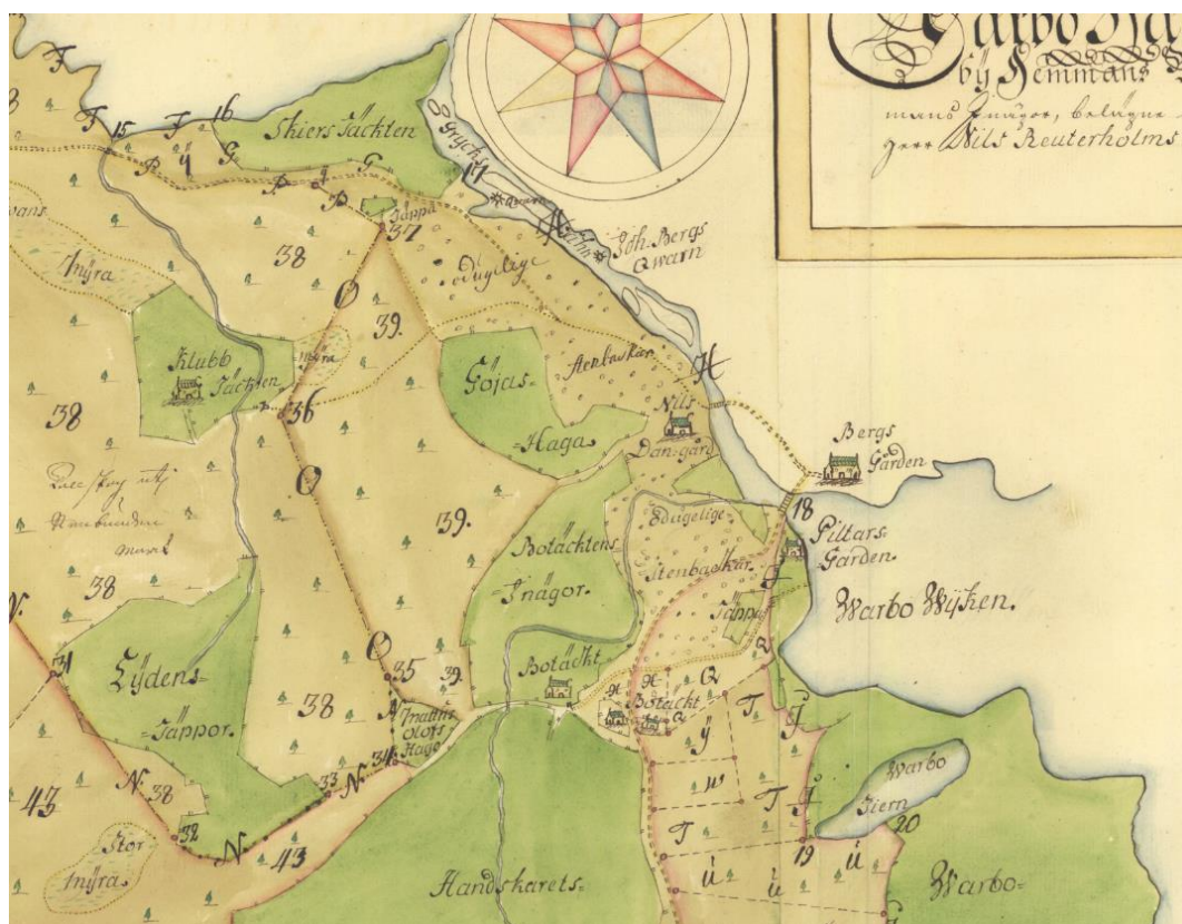
Utdrag ur karta från 1738.

Under 1700-talets mitt består Bergsgården av Klubbträkten, Järgarvet, Gassarvet, Nygården, Bergsgården och Botäkt. Slättmyra finns som rubrik i husförhörlängden, men verkar obebott. Mot slutet av seklet listas även Smedsarvet. Från kartor framgår att det finns odlingar (och troligen då också boende) i Varbo, Tomsarvet, Bondberg och Norlingberg. Under 1750-talet bor det lite drygt 200 personer i Bergsgården, den exakta siffran är lite oklar eftersom det från källmaterialet inte framgår hur pigor och drängar flyttar runt under perioden. 8